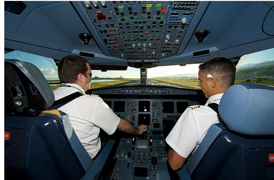
Figuur 5: cockpit opstijgend vliegtuig

Door nu de juiste bestemming te kiezen is de Groene Vooroploper het beste op het gebied van wonen, werken en recreëren in Nederland. Leven in een nieuwe omgeving die precies op maat en altijd duurzaam is.