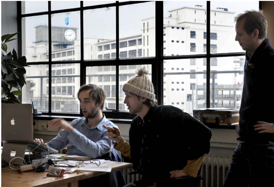
Figuur 4: startups in Eindhoven

Avenue2 en vroegen om een nieuwe plek in het gebied waar ze hun bedrijfsactiviteiten nu nog steeds voortzetten. De ondernemers wonen ook niet meer boven hun bedrijfje, maar hebben collectief een bestaand pand tot luxe appartementencomplex omgetoverd.