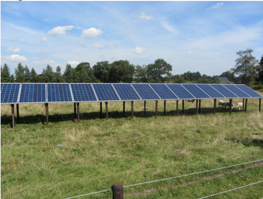
Figuur 3: zonnepanelen in de wei

In 2015 vond men energieneutraal bouwen nog spannend! Dat is het allang niet meer sinds de overheid het in 2020 via het bouwbesluit verplichtte. Des te beter dat hier in 2015 meteen op geanticipeerd werd door een eigen energieleverancier in het leven te roepen. Eén van de eerste initiatieven was het aanschaffen van zonnepanelen met een subsidie en lening van de Provincie. Deze zonnepanelen leverden meteen al energie voor het bestaande vastgoed wat weer in gebruik werd genomen door allerlei startups. Jaren later werden deze zonnepanelen geïnstalleerd op de nieuwe huurwoningen van Servatius. Het mooie is dat de corporatie niet hoeft te betalen voor de aanschaf van deze zonnepanelen, maar dat ze geleased worden van de energieleverancier.