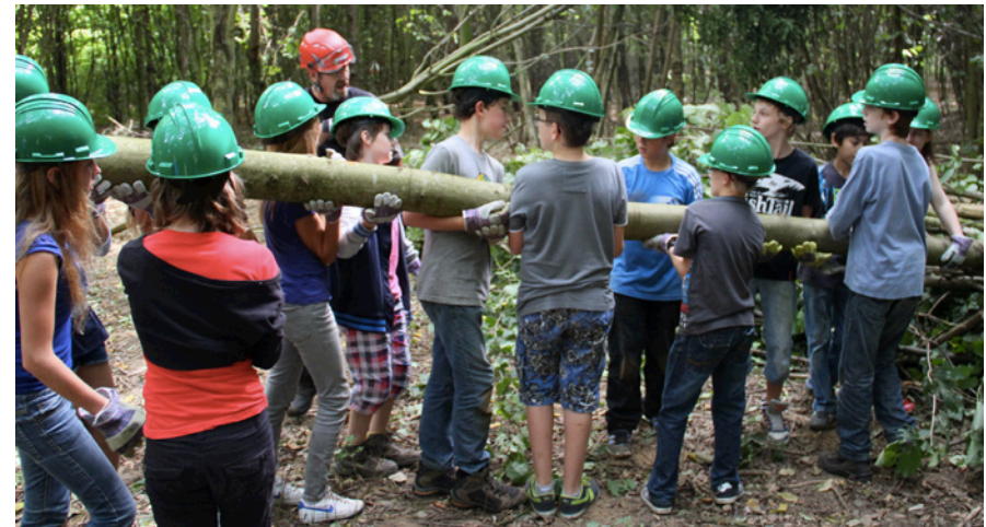
Figuur 2: leerlingen in hun adoptiebos

geadopteerd. Samen met vrijwilligers en startups onderhouden we samen het groen en de leerlingen krijgen les over alles wat in de natuur te zien is. Zo houden we de verdiensten kort bij onze eigen initiatieven.